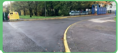
Frente a la politécnica